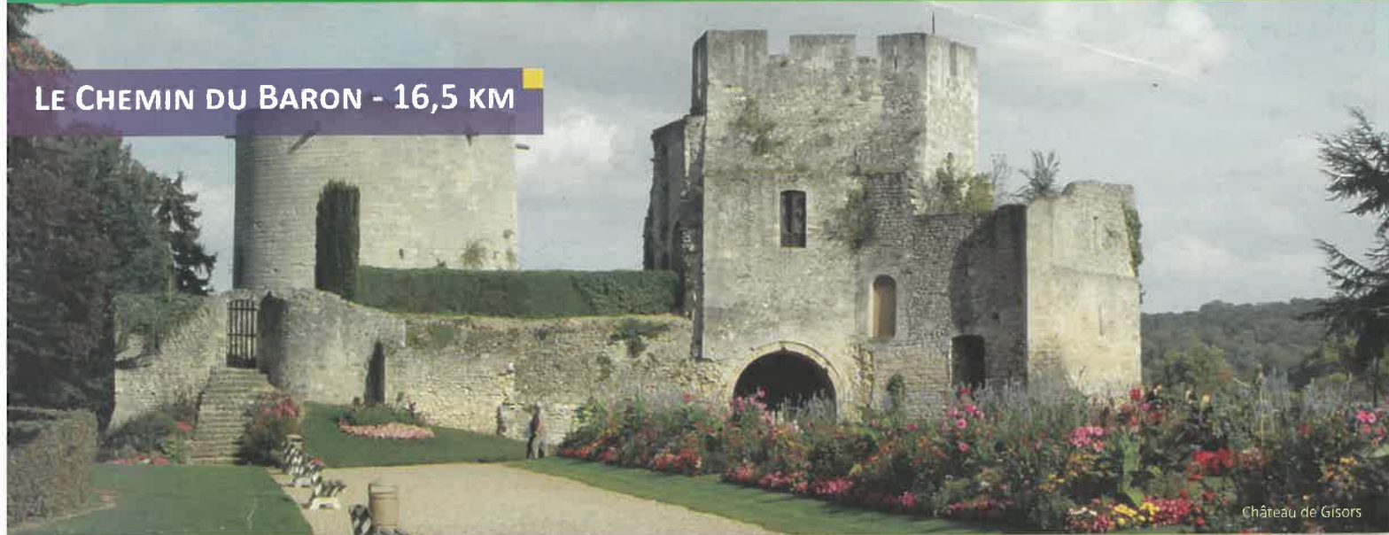
Château de Gisors